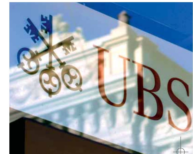
Banken: Kunden können zu viel bezahlte Gebühren rückwirkend für die